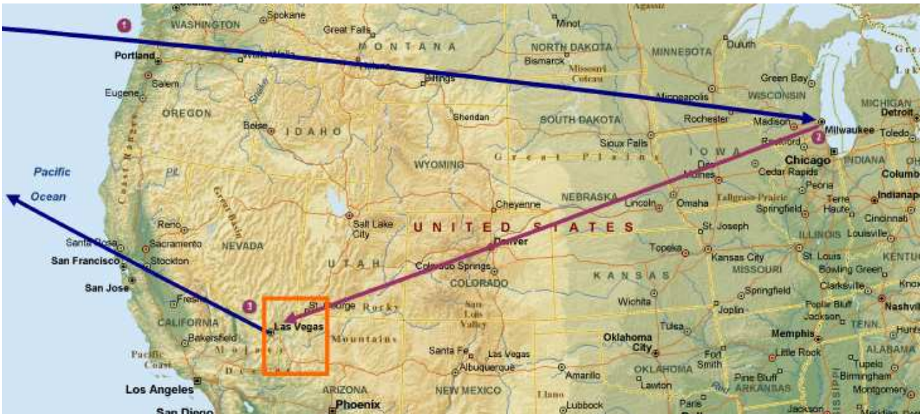
LAUGHLIN GRAND CANYON 1000km